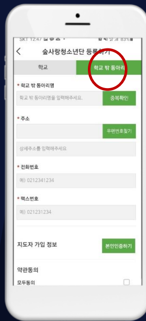
학교 밖 동아리 등록